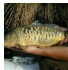
La carpa, regina dei zumi