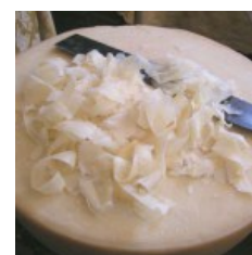
La raspadyra, un grana di strada