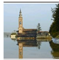
Fotografare l'emozione del momento