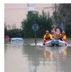
Colpevoli di calamità naturali